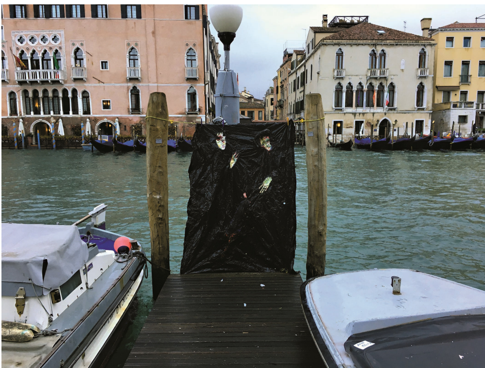
10. Федір Александрович. З проекту «Привиди Бучі». 2023