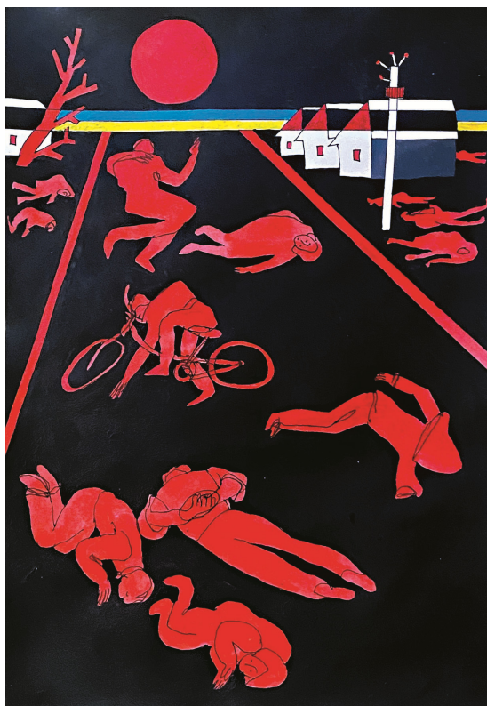
1. Антон Логов. Буча. 21x29 paper. 2022