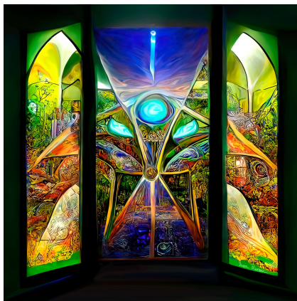
4. Gydravlik. CryptoGeometry AI. ©Gydravlik