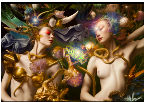
2. V4W.ENKO. AWFS#13_RM_LAA80_STTC.