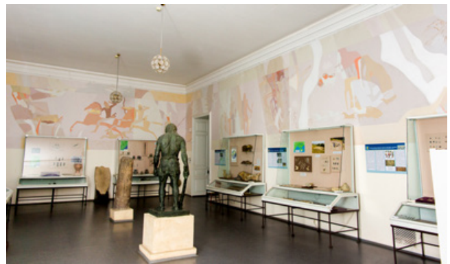
Розпис в Одеському археологічному музеї, 1983–1984