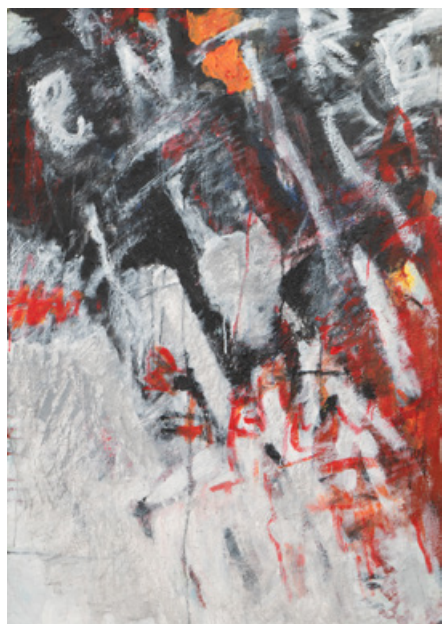
Без назви, 100 x 60 см, полотно, акрил, 2022