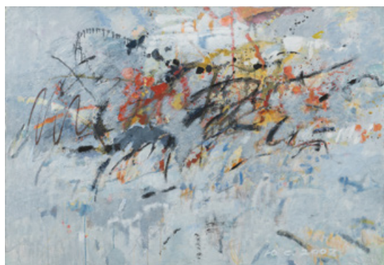
Експресія II, 130 x 90 см, полотно, акрил, 2007