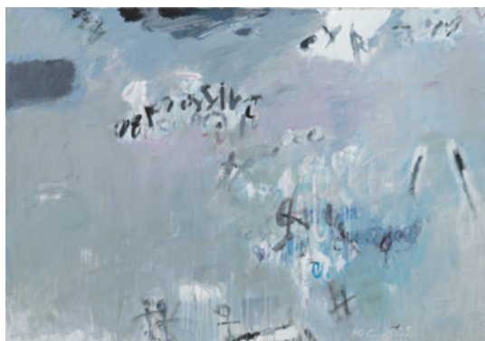
Експресія, 130 x 90 см, полотно, акрил, 2008