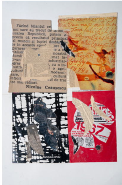
Колаж, папір, 80 x 60 см, кінець 1980-х