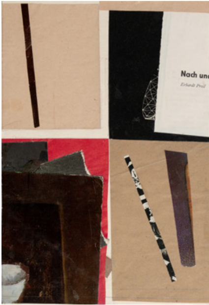
Колаж, папір, 21 x 15 см, кінець 1970-х