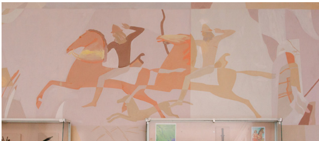
Розпис в Одеському археологічному музеї, 1983–1984