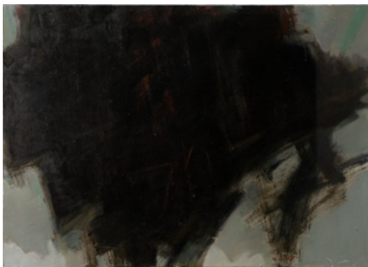
Тьмяна стихія, 64 x 90 см, полотно, олія, 1995