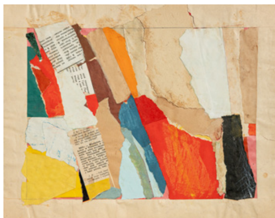
Колаж, папір, 35 x 25 см, середина 1980-х