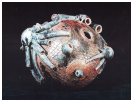
4. Батискаф, Декоративна ваза. 1991. Шамот, солі.