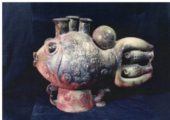
6. Велика риба, 1991. Шамот, відновлення.