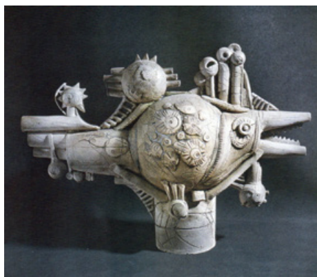
2. Диптих «Космічні риби». Добра риба, 1980. Шамот, солі.