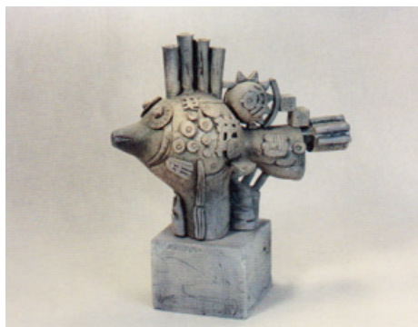
3. Мала риба, 1991. Шамот, солі, поливи