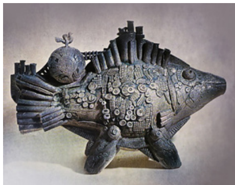
1. Диптих «Космічні риби». Добра риба, 1980. Шамот, солі.