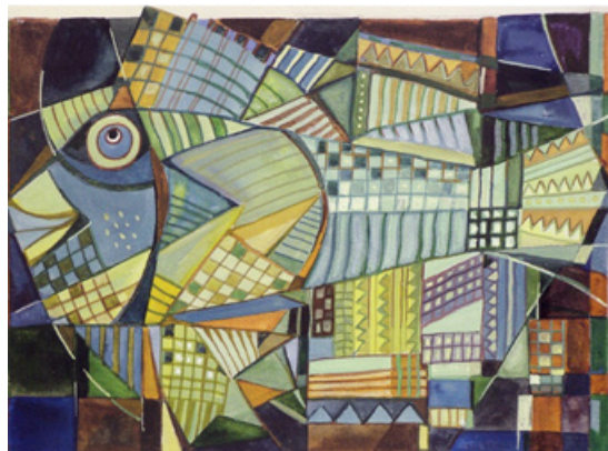
8. Риба з сузір'я, 2001. Папір, акварель, темпера.