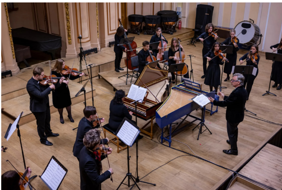
Концерт-закриття Фестивалю давньої музики у Львові, листопад 2024 року.