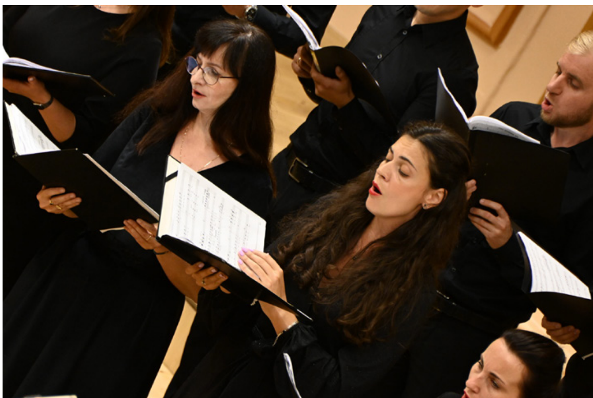
Виступ ансамблю «A capella Leopoldis» на Фестивалі давньої музики у Львові (2023).