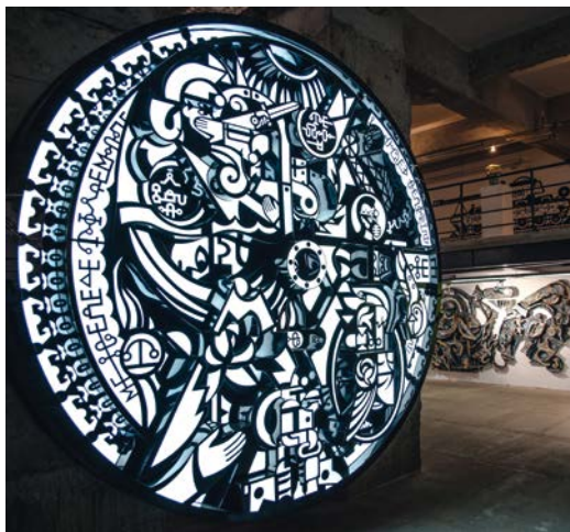
«Нагорода за мовчання», 2014