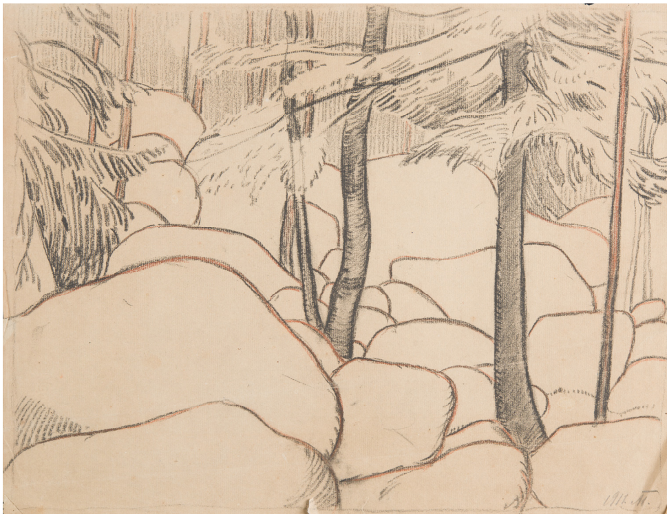
4. Фінський пейзаж. 1911. Папір, сангіна, олівець Negro. ЦДАМЛМ України