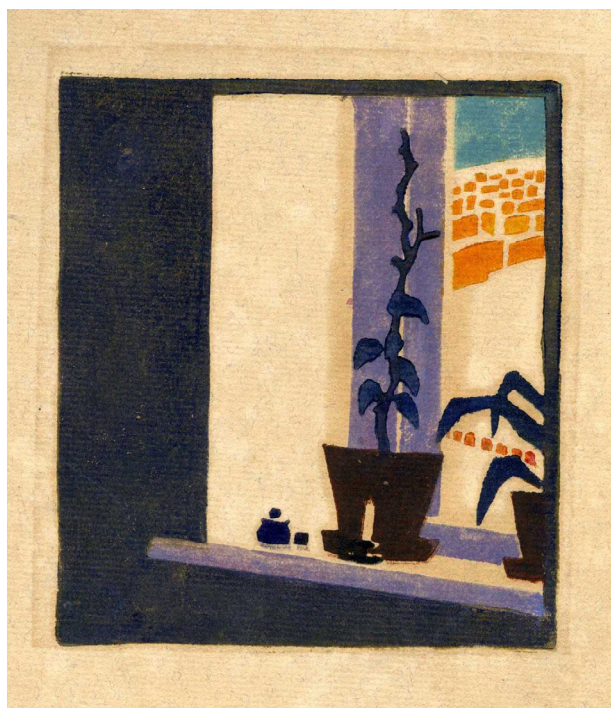
6. Горщик із рослинами на підвіконні. [1913] Папір, кольорова ліногравюра. ЦДАМЛМ України. Репродуковано з видання: Олександр Богомазов: творча лабораторія: науковий каталог / Упорядник О. Кашуба-Вольвач. Київ : НХМУ, 2019. С. 277