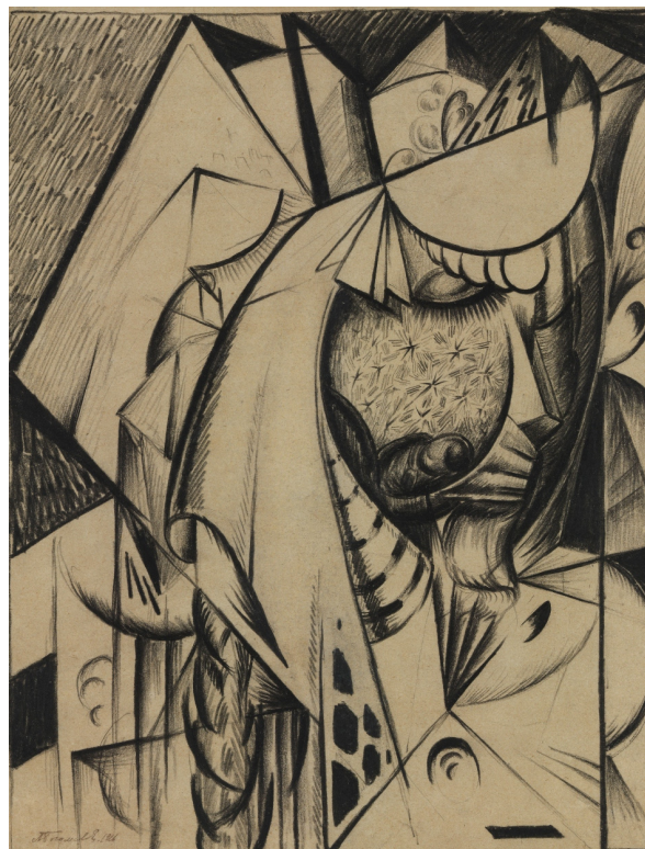
12. Вірменка. 1916. Папір, олівець Negro. Приватна збірка