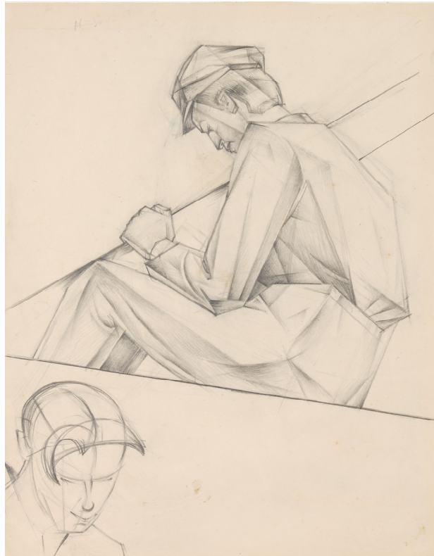
15. Пиляр. [1927]. Папір, графітовий олівець. НХМУ