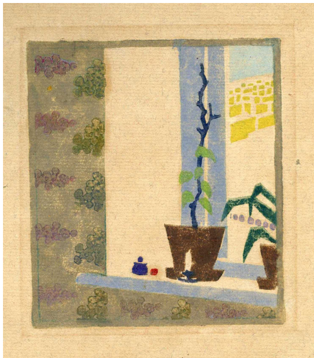
5. Горщик із рослинами на підвіконні. [1913] Папір, кольорова ліногравюра. ЦДАМЛМ України. Репродуковано з видання: Олександр Богомазов: творча лабораторія: науковий каталог / Упорядник О. Кашуба-Вольвач. Київ : НХМУ, 2019. С. 277