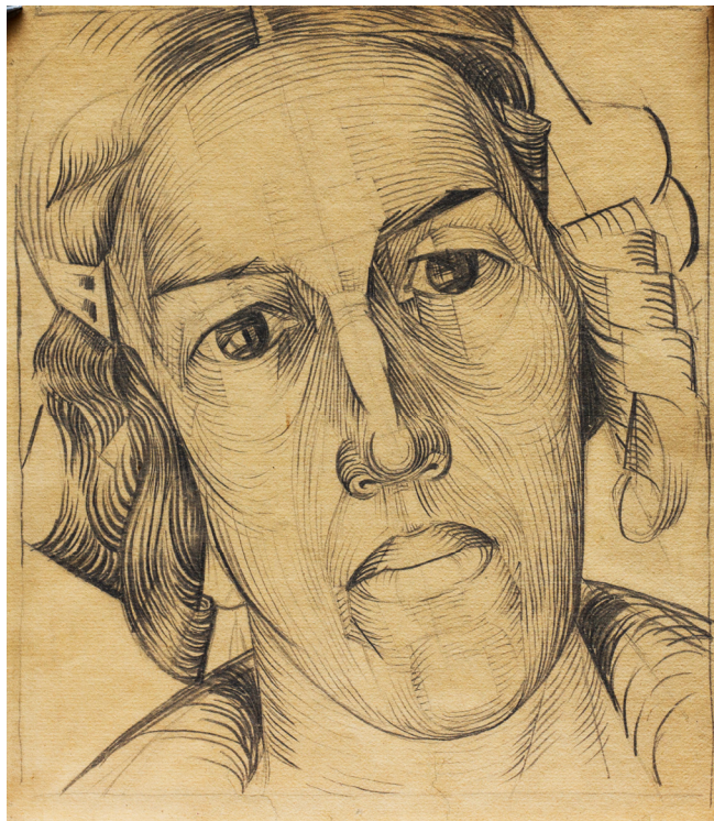
16. Портрет дружини. [1925–1930]. Папір, графітовий олівець. МОХМ (Миколаїв)