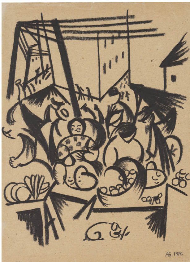
9. Базар. 1914. Сірий папір, олівець Negro. НХМУ