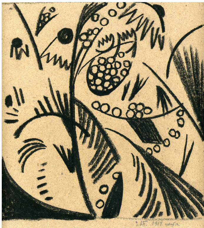
10. Квіти. 1914. Сірий папір, олівець Negro. ЦДАМЛМ України