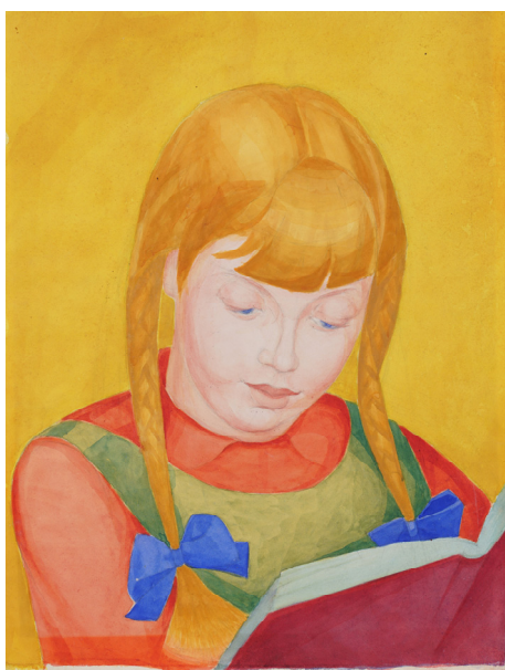
14. Портрет дівчинки, яка читає книжку (Донька художника О. К. Богомазова). [1923]. Папір, акварель. Збірка "Нью Арт", Київ