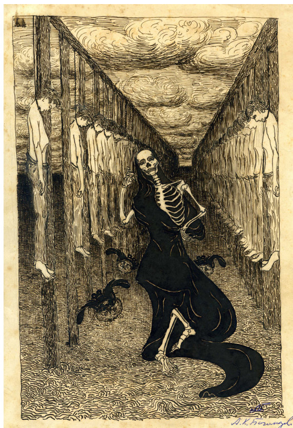
1. Танок смерті серед повішених. 1905. Папір, туш. ЦДАМЛМ України