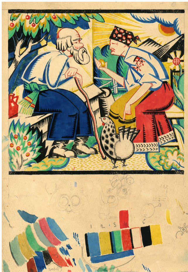
13. Ілюстрація до народної казки «Курочка ряба». [1919–1923]. Папір, акварель, туш. ЦДАМЛМ України. Репродуковано з видання: Олександр Богомазов: творча лабораторія: науковий каталог / Упорядник О. Кашуба-Вольвач. Київ : НХМУ, 2019. С. 350