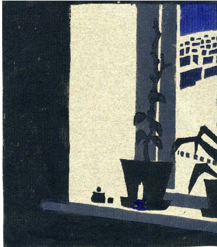
7. Горщик із рослинами на підвіконні. [1913] Папір, кольорова ліногравюра. ЦДАМЛМ України. Репродуковано з видання: Олександр Богомазов: творча лабораторія: науковий каталог / Упорядник О. Кашуба-Вольвач. Київ : НХМУ, 2019. С. 276