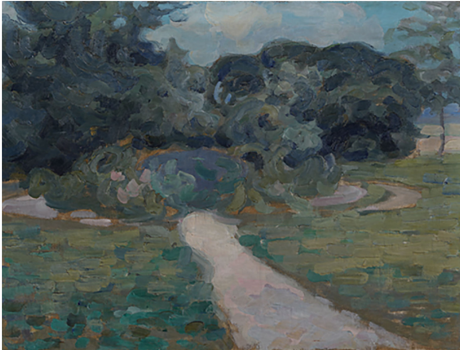
3. Аля. [1907]. Полотно на дикті, олія. Приватна збірка, Київ