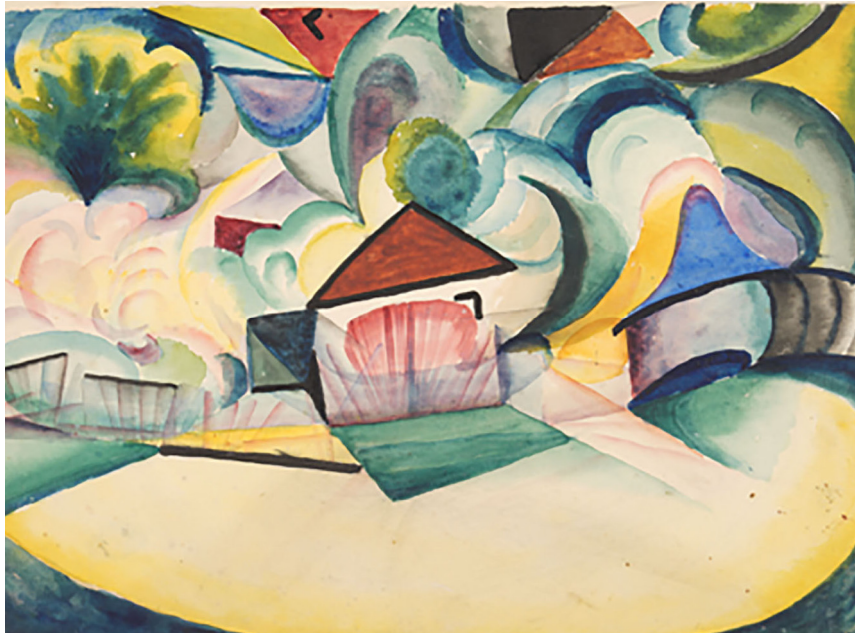
8. Боярка. [1913-1914]. Папір на картоні, акварель. НХМУ