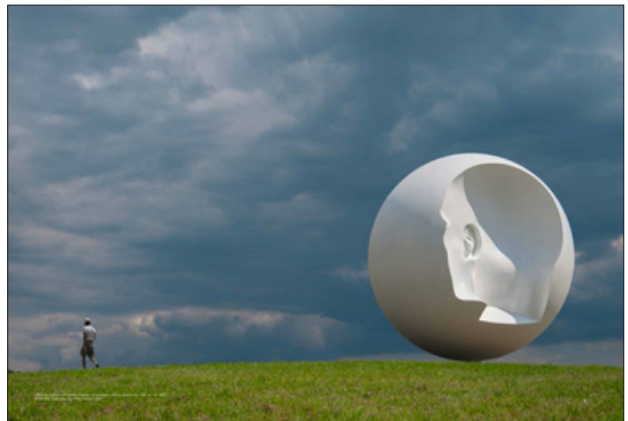
Приклад сторінок Назара Білика в альбомі-монографії «30 років присутності: Сучасні українські художники», (Київ: ArtHuss, 2022)