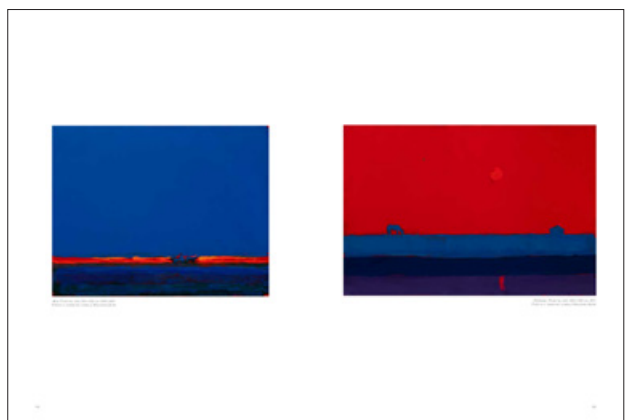
Приклад сторінок Анатолія Криволапа в альбомі-монографії «30 років присутності: Сучасні українські художники», (Київ: ArtHuss, 2022)