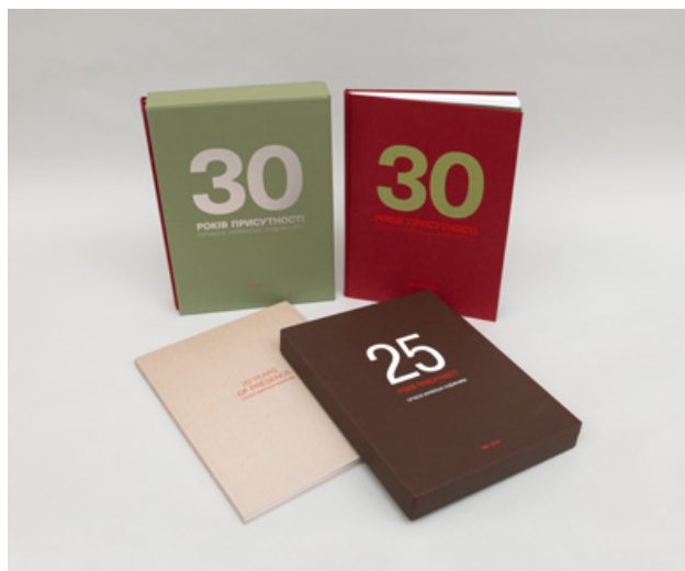
Альбоми: «20» (1 том); «25 років»(2 тома) та «30 років присутності» (3 тома)