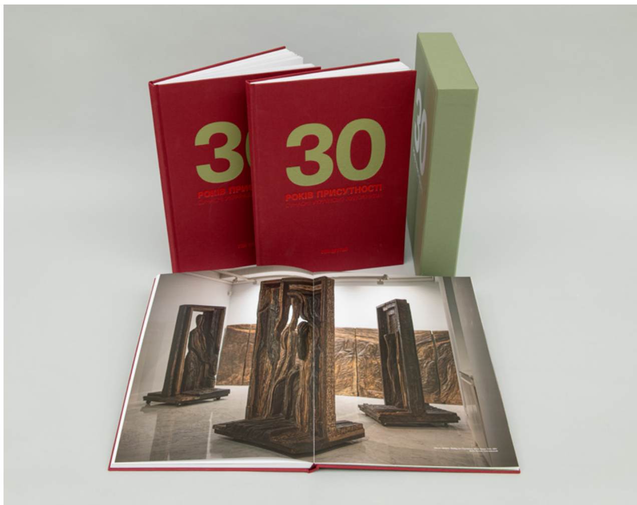
Приклад сторінок Олександра Животкова в альбомі-монографії «30 років присутності: Сучасні українські художники», (Київ: ArtHuss, 2022)