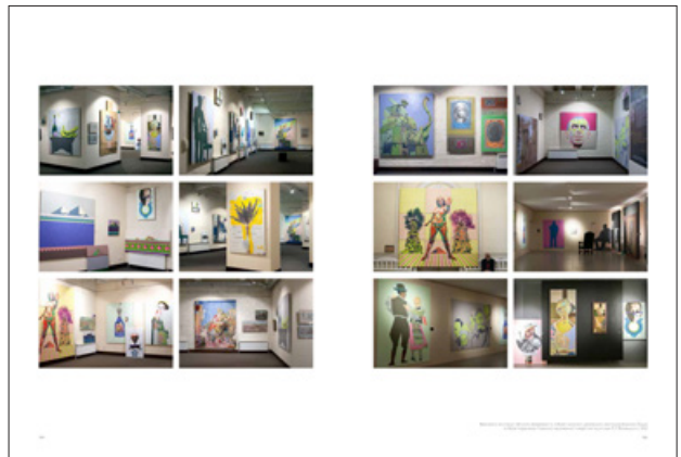
Приклад сторінок Олега Тістола в альбомі-монографії «30 років присутності: Сучасні українські художники», (Київ: ArtHuss, 2022)