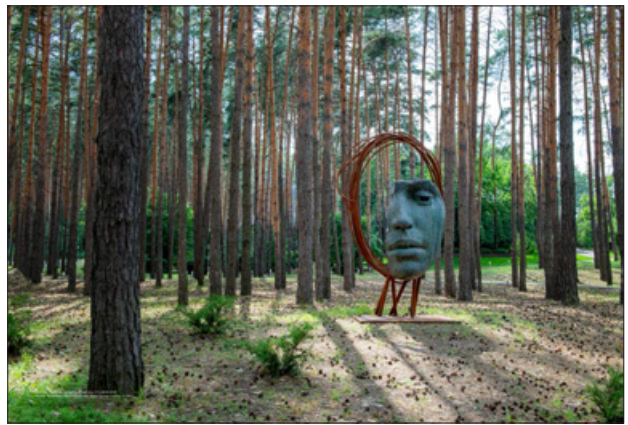
Приклад сторінок Дмитра Грека в альбомі-монографії «30 років присутності: Сучасні українські художники», (Київ: ArtHuss, 2022)