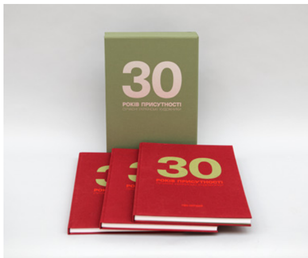
Альбом «30 років присутності» — 3 тома та чохол