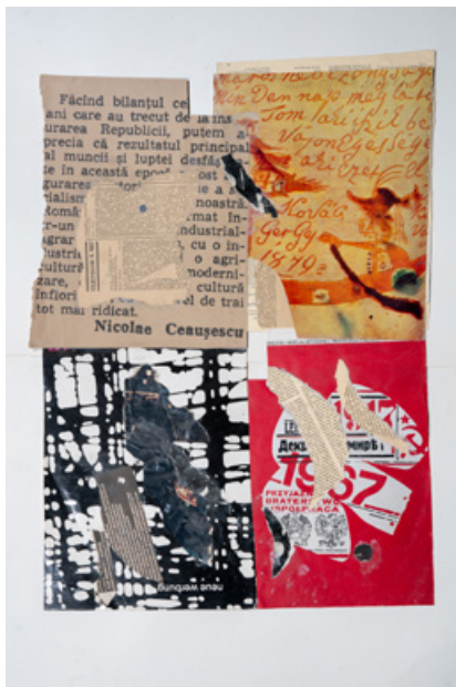
Колаж, папір, 80 x 60 см, кінець 1980-х