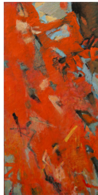
В полум'ї, 100 x 50 см, полотно, акрил, 2001