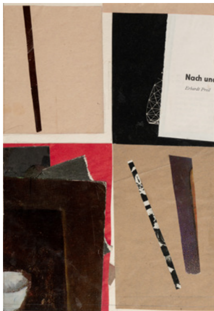
Колаж, папір, 21 x 15 см, кінець 1970-х