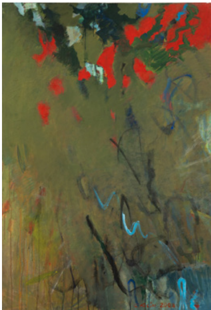
Вечірне, 130 x 90 см, полотно, акрил, 2008