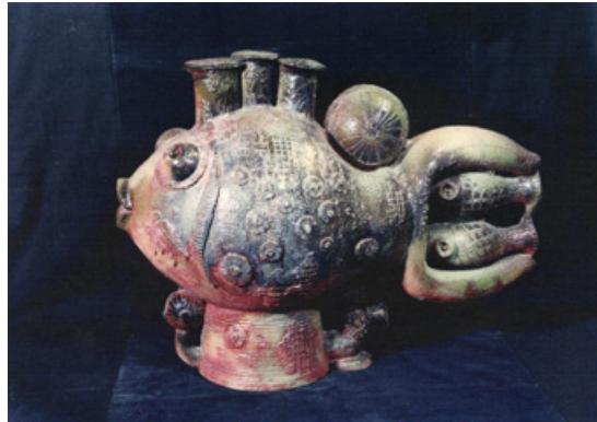
6. Велика риба, 1991. Шамот, відновлення.