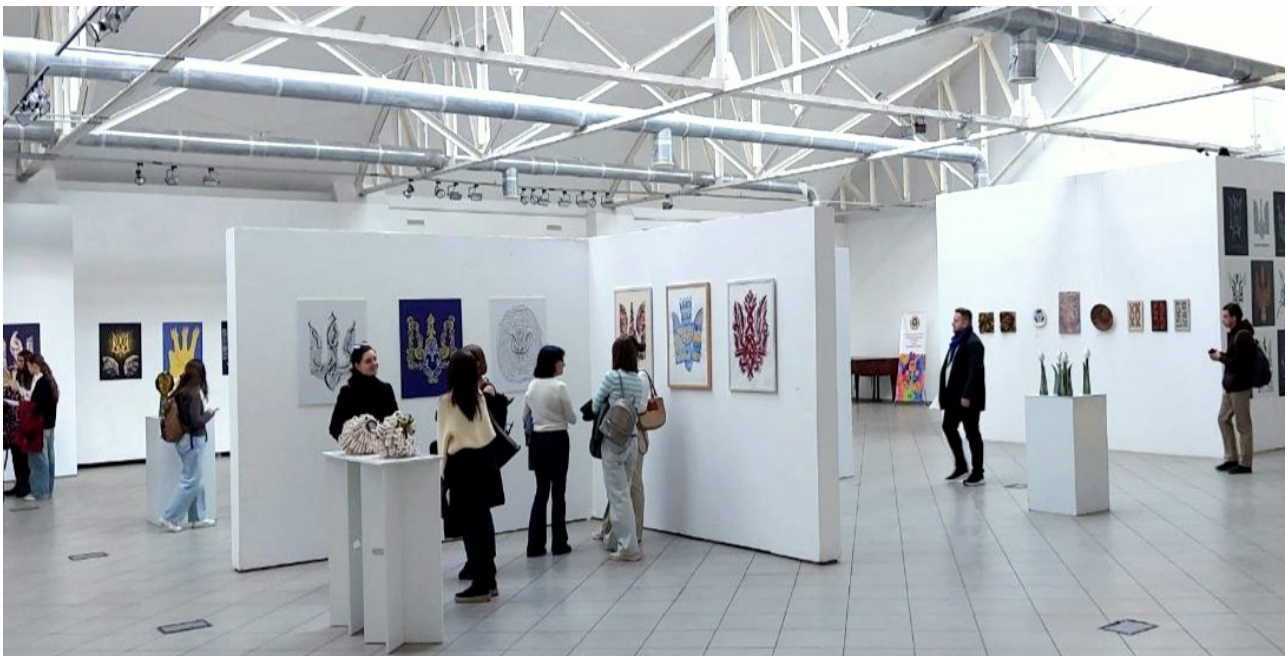
Іл. 8. Проект «Символи ідентичності». 2025