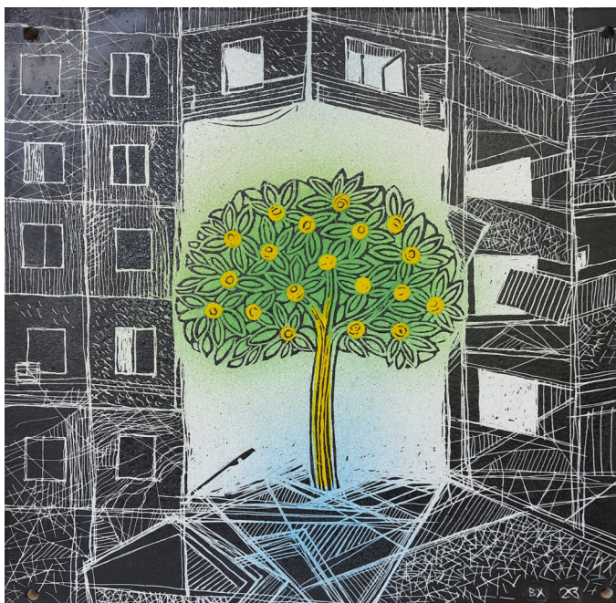
Іл. 4. В. Хижинський. «Яблуня». 2022. Шамот, поливи, надглазурний розпис