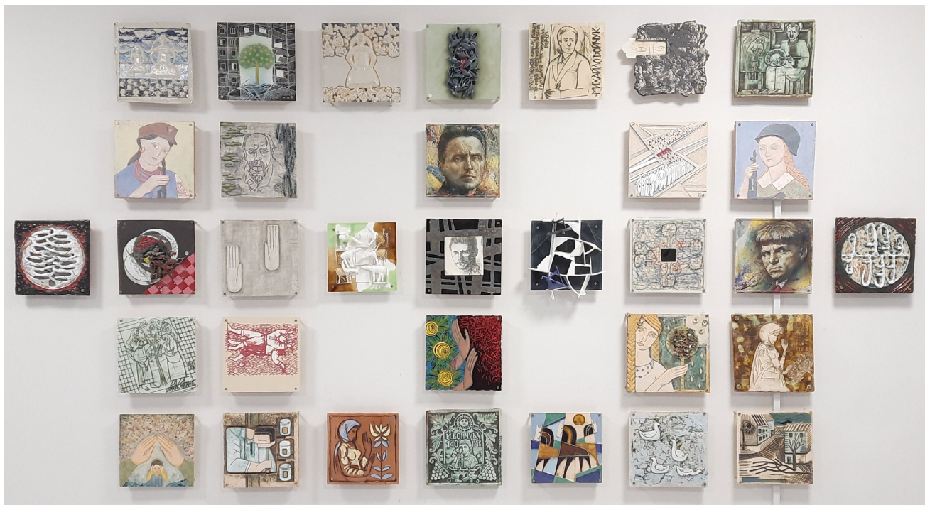
Іл. 1. «Стіна пам'яті М. Бойчука» у холі КДАДПМД імені М. Бойчука. 2022. Загальний вигляд