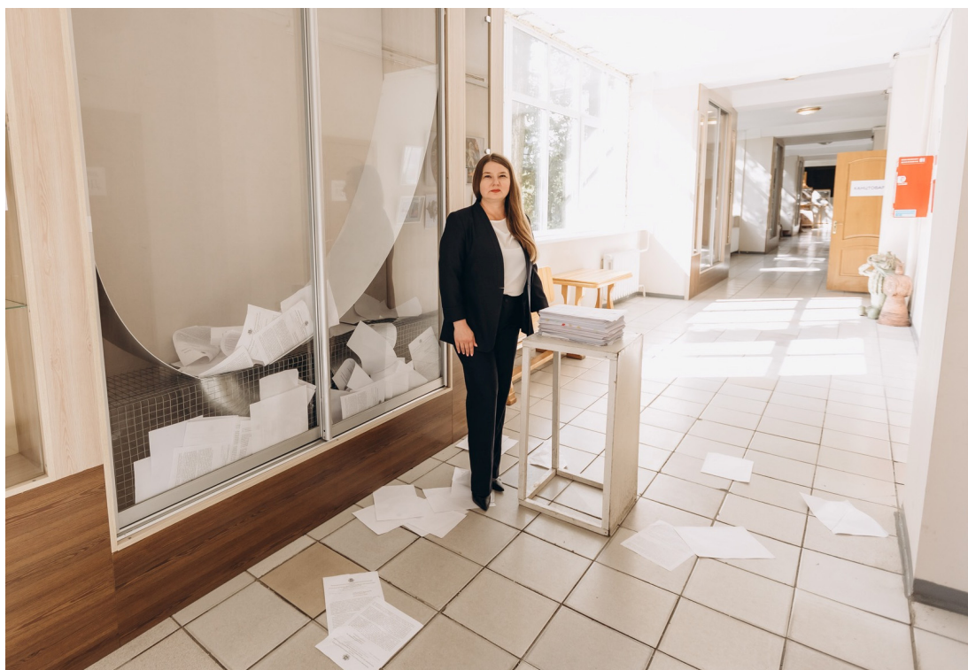
Іл. 6. О. Осадча. Перформативна інсталяція «Листи щастя» на виставці «Стан невагомості». 2024