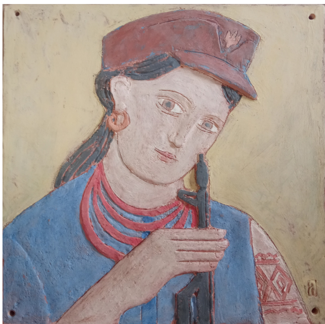
Іл. 2. Л. Нагірняк. Пласт за мотивами роботи О. Саєнка. 2022. Шамот, ангоби