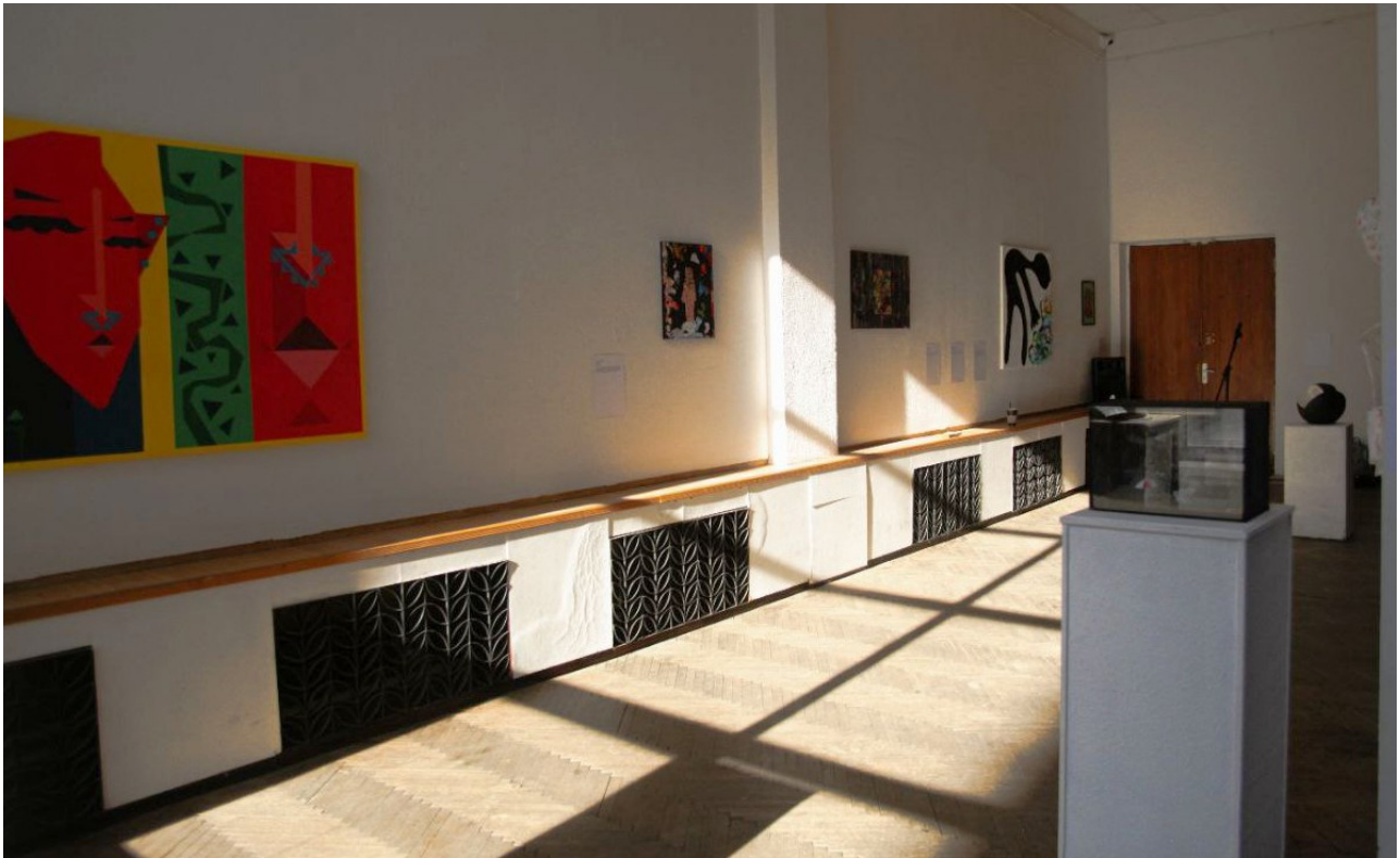
Іл. 7. Проект «Ентропіогенезис». Куратор М. Вайда. 2025