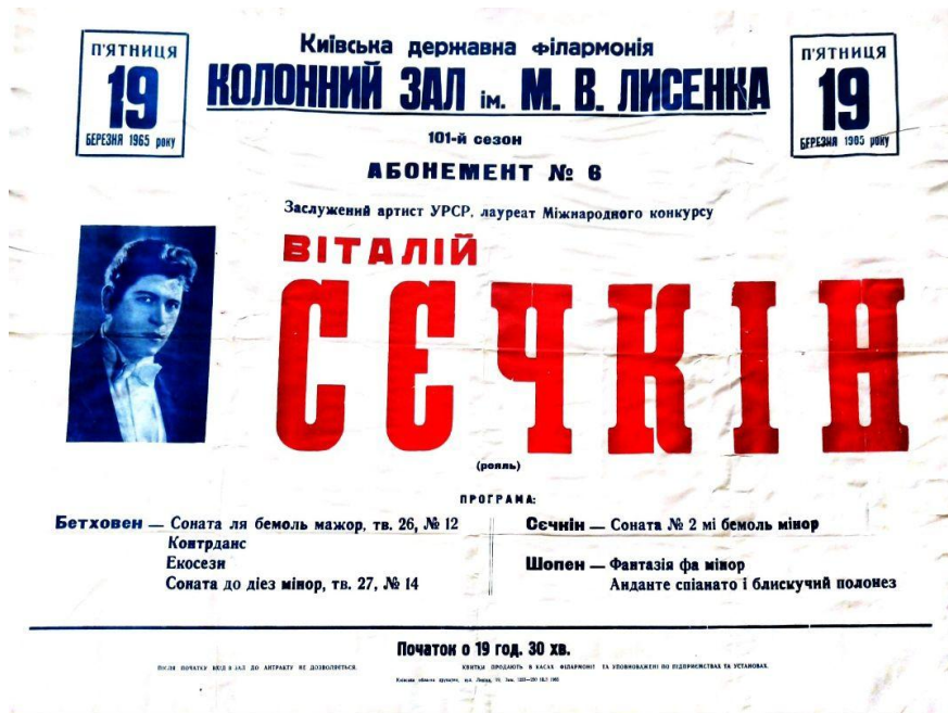
Іл. 1. Афіша сольного концерту Віталія Сечкіна у Київській державній філармонії (1965)