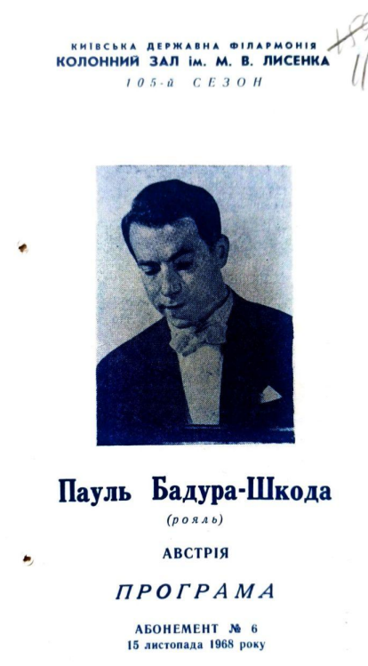
Іл. 3. Обкладинка програми виступу австрійського піаніста Пауля Бадурі-Шкоди у Київській державній філармонії (1968)