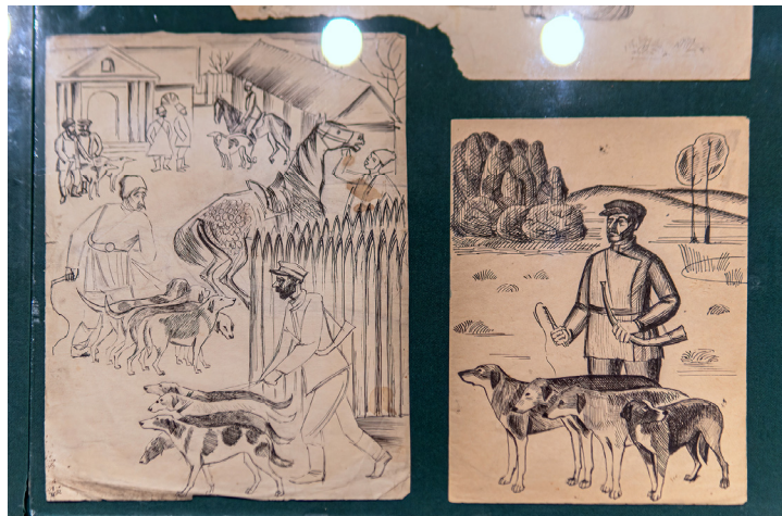
Іл. 18. Твори Євгена Ситнянського з родинного архіву Галини Дюговської. Фрагмент експозиції «Авангард. АРМУ. Початок». Національна академія образотворчого мистецтва і архітектури.