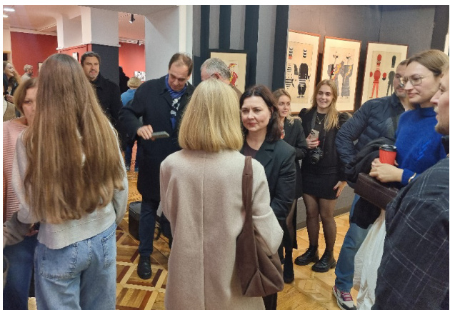
Іл. 7. Відкриття виставки «Авангардна Україна». Музей театрального музичного та кіномистецтва України