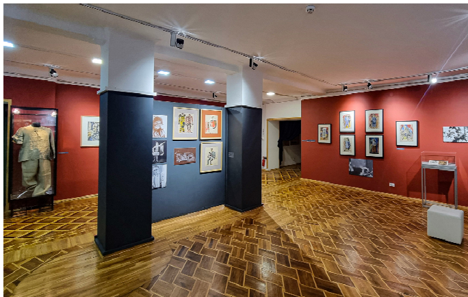
Іл. 8. Фрагмент експозиції «Авангардна Україна». Музей театрального музичного та кіномистецтва України