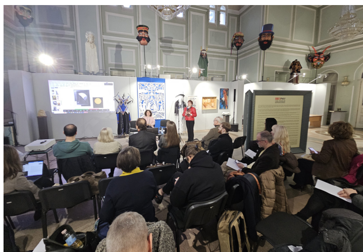
Іл. 19. Міжнародна науково-практична конференція «100 років АРМУ». Національна академія мистецтв України