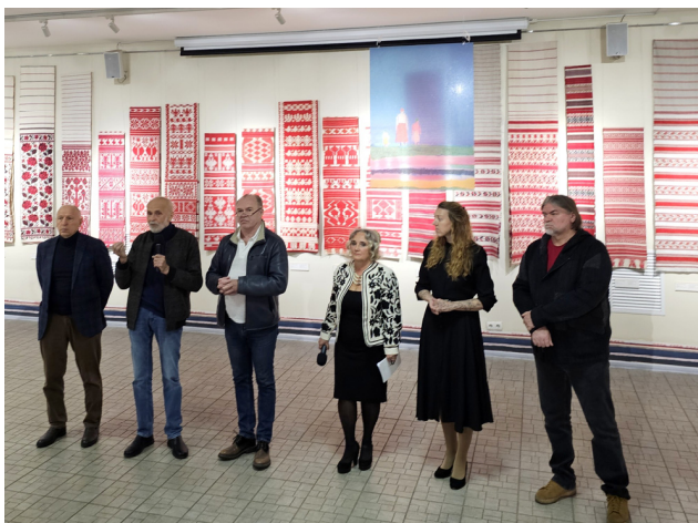
Іл. 5. Відкриття виставки «Авангард. Витоки». Музей Івана Гончара