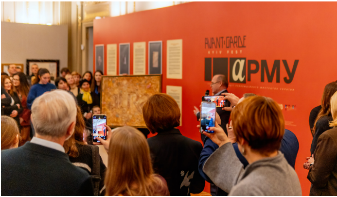
Іл. 11. Відкриття Музею авангарду.