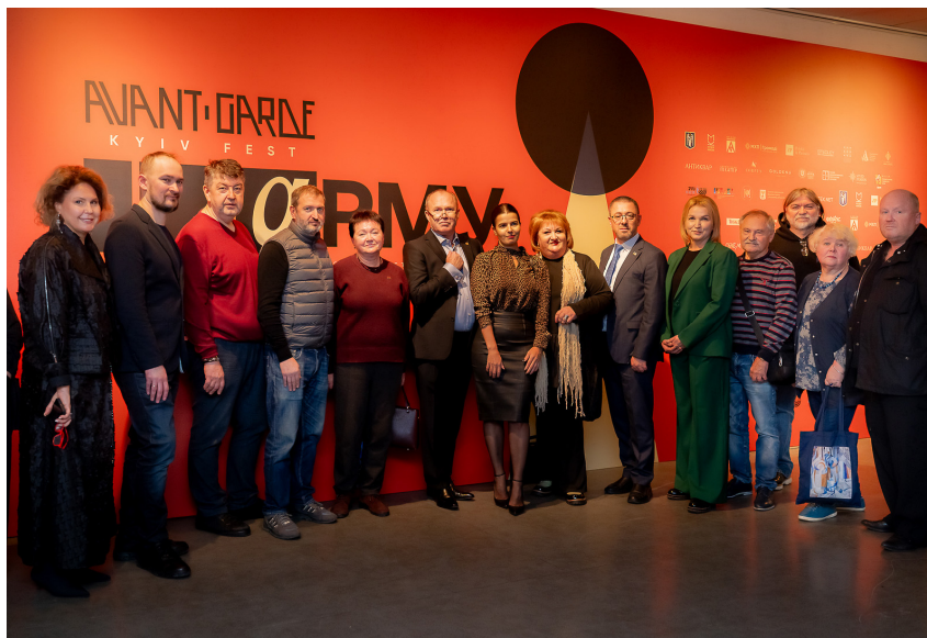
Іл. 1. Відкриття «Avant-Garde Kyiv Fest». Музей історії міста Києва.