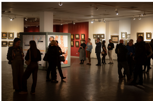
Іл. 4. Відкриття «Avant-Garde Kyiv Fest». Музей історії міста Києва.