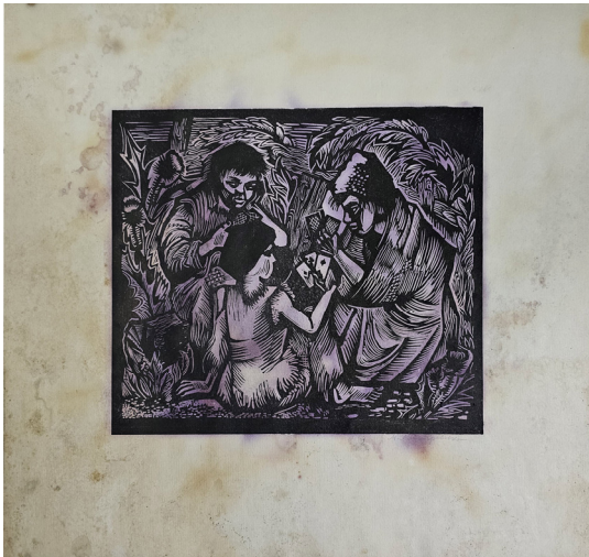
Іл. 13. Марія Котлярєвська. Безпритульні. 1927 р. Ліногравюра