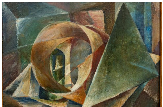
Іл. 16. Макаревич (?). Натюрморт. Завдання на вивчення мистецької течії кубізму. 1920-ті. Фрагмент експозиції «Авангард. АРМУ. Початок». Національна академія образотворчого мистецтва і архітектури.