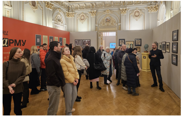
Іл. 12. Експурсія в Музеї авангарду