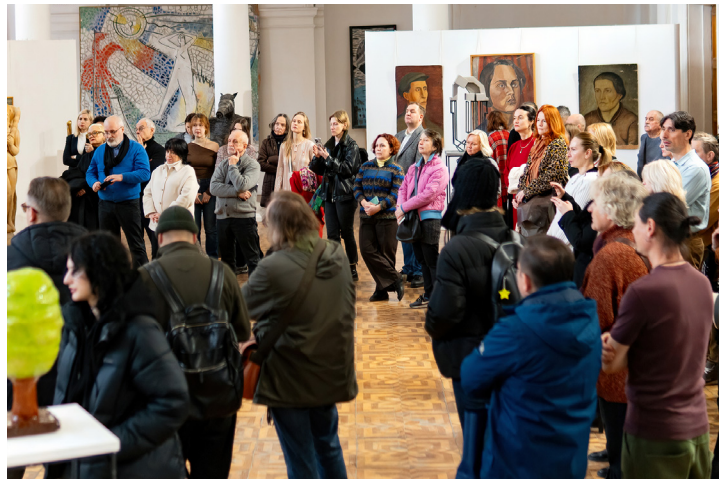
Іл. 17. Відкриття виставки «Авангард. АРМУ. Початок». Національна академія образотворчого мистецтва і архітектури.