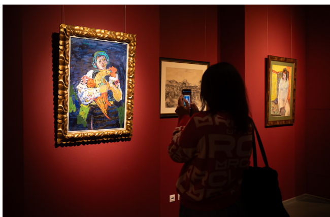
Іл. 3. Микола Глущенко. Гуцулка з півнем. 1967 р. Картон, олія. Надано Аукціонним домом «Goldens». Фрагмент експозиції «Avant-Garde Kyiv Fest». Музей історії міста Києва. Фото Є. Зінченка