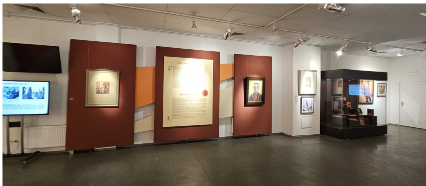
Іл. 2. Фрагмент експозиції «Avant-Garde Kyiv Fest». Музей історії міста Києва