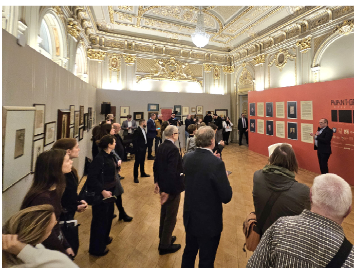
Іл. 10. Відкриття Музею авангарду