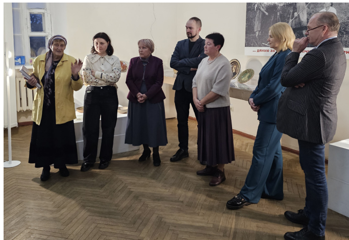
Іл. 6. Відкриття виставки «Авангард. Освіта». Національний музей декоративного мистецтва України