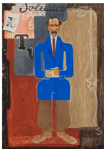
Іл. 9. Вадим Меллер. Ескіз костюму до п'єси «Джиммі Хігінс» Е. Сінклера. 1923 р. Фрагмент експозиції «Авангардна Україна».